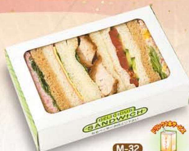
M-32 サンドイッチ【ジョイ】