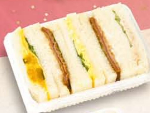
M-30 サンドイッチ【ハムカツ】