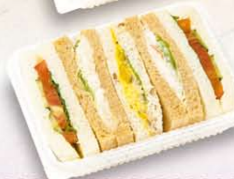
M-31 サンドイッチ【ベジタブル】